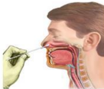
Hình 3: Lấy mẫu dịch ngoáy mũi