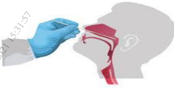
Hình 1: Lấy mẫu ngoáy dịch ty hầu